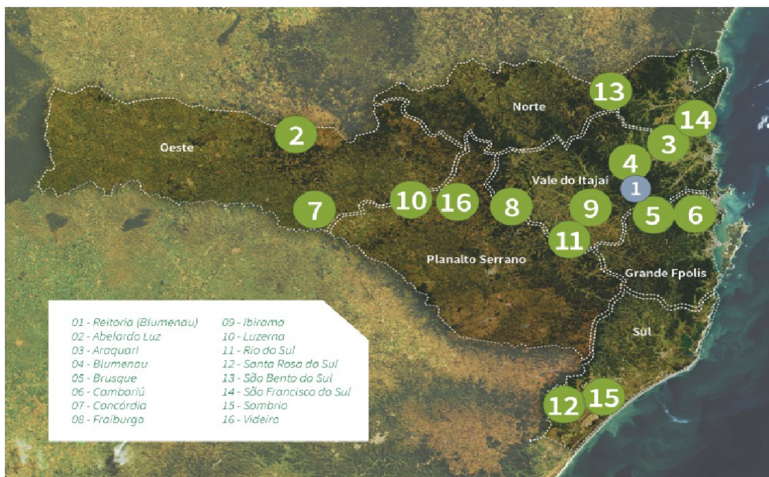
Figura 1- Mapa de Abrangência Institucional - IFC