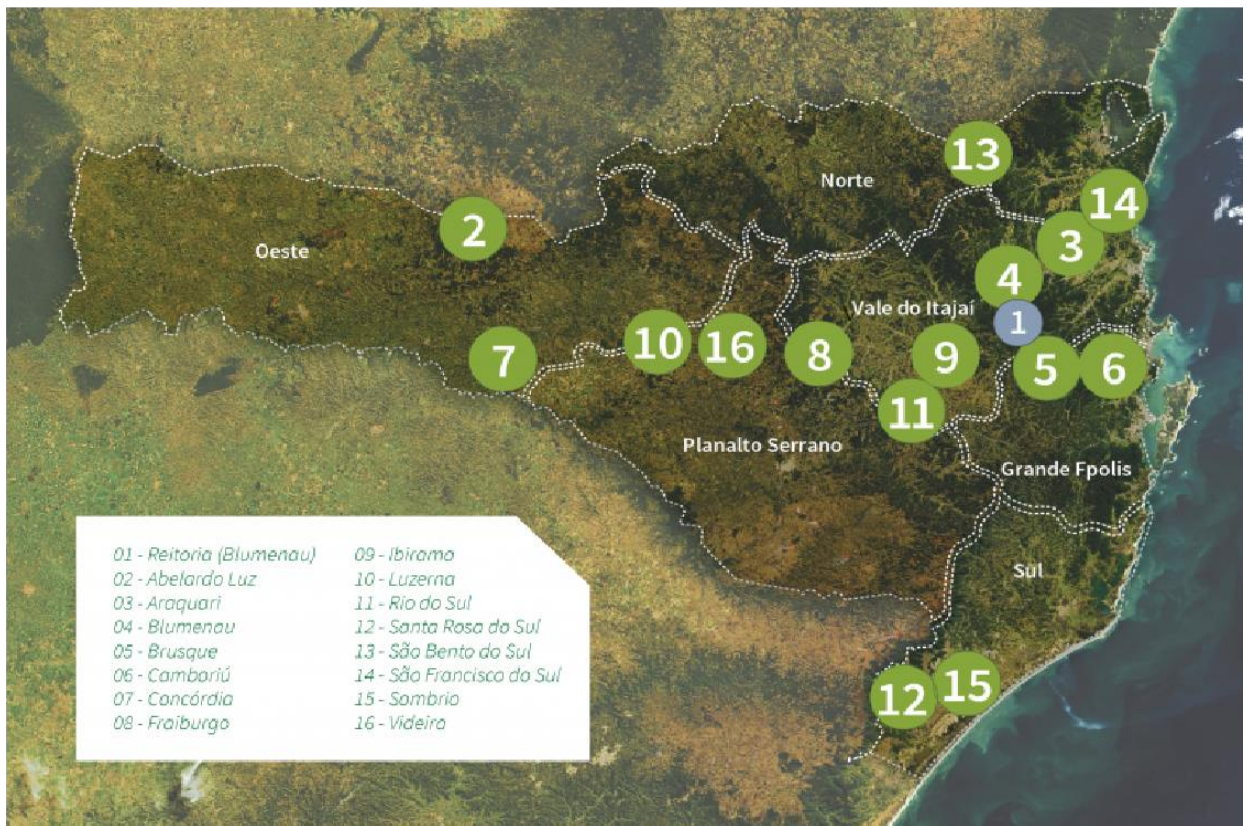
Figura 1: Mapa de Abrangência Institucional (IFC)